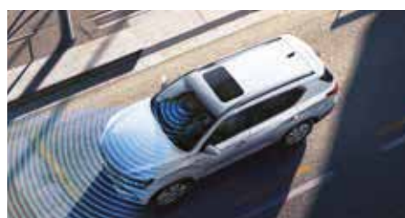
Système de freinage d'urgence automatique (AEB)