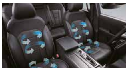
Sièges ventilés à l'avant