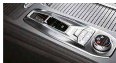
Nouvelle boîte automatique à 8 rapports