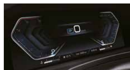
Instrumentation numérique 12,3 pouces