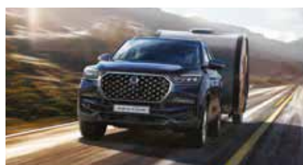
Capacité de traction jusqu'à 3500 kg