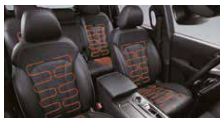
Sièges chauffants à l'avant et à l'arrière