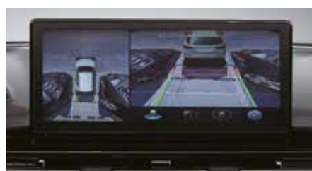
Caméra 360° (Around View Monitoring)