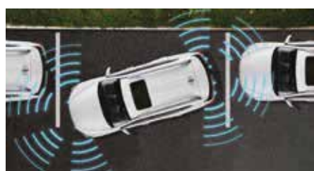
Capteurs de stationnement avant et arrière

Plus sûr, plus puissant et plus séduisant que jamais, le nouveau Rexton est un authentique SUV qui vous garantit une conduite somptueuse. A bord, ses systèmes de technologie embarqués définissent de nouveaux standards en matière de raffinement, de grand confort et de sécurité. Par son design, le Rexton affirme fièrement la force et la beauté de son caractère.